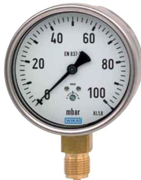
Manometr puszkowy model 612.20