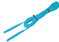
Przewód 5 m niebieski 1 kV (wtyki bananowe)