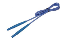
Przewód 1,2 m niebieski 1 kV (wtyki bananowe)