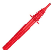
Sonda ostrzowa czerwona 1 kV (gniazdo bananowe)