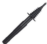
Sonda ostrzowa czarna 1 kV (gniazdo bananowe)