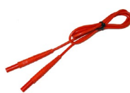
Przewód 1,2 m czerwony 1 kV (wtyki bananowe)