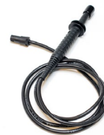
Sonda bezdotykowa WASONBDOT