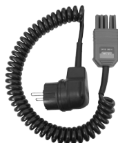
Adapter WS-05 (wtyk kątowy UNI-Schuko) WAADAWS05