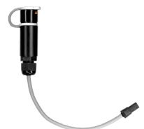
Adapter LKO-720 C-3/C-8 WAADALKOC8