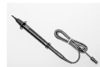
Sonda dotykowa WASONDOT