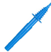
Sonda ostrzowa niebieska 1 kV (gniazdo bananowe) WASONBU0GB1