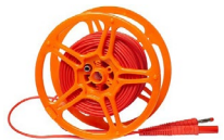
Przewód 20 m czerwony 1 kV na szpuli (wtyki bananowe) WAPRZ020REBBSZ