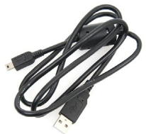
Przewód do transmisji danych mini-USB WAPRZUSBMNIB5