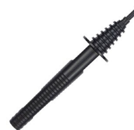
Sonda ostrzowa czarna 11 kV (gniazdo bananowe) WASONBLOGB11