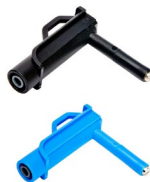
Adapter napięciowy magnetyczny - kolor czarny / niebieski WAADAUMAGKBL WAADAUMAGKBU