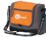
Futurał M-6 WAFUTM6